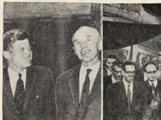
Riba e prone graña president Kennedy ta deliberando cu Lord Howe na Casa Blanca pa stop e expansion di e comunismo, y riba e otro ta sparte president di Cuba, Oswaldo Dorticos na su yegada na New York, pa atende e sesionnan di United Nations General Assembly.